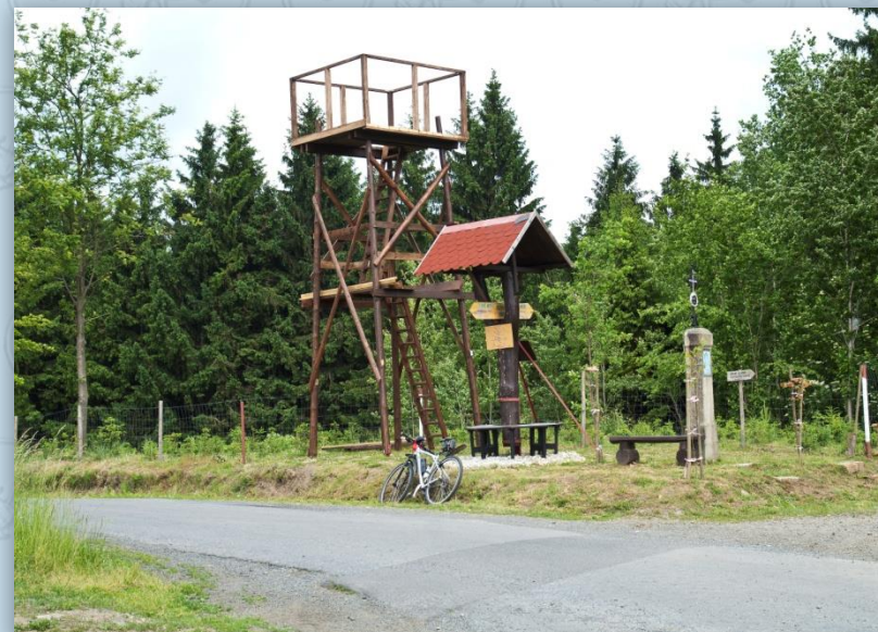
Rozvodí nad Novou Vsí

. Jsou to pozůstatky po dolování železné rudy. Cesta je dobře sjízdná, pouze v závěru tohoto lesního úseku je prudké klesání, kde je třeba větší opatrnosti. Vyjedem u malého rybníku. Pokračujeme do obce Štefle. Zde, na horizontu, budeme pokračovat vpravo, po asfaltce, až do Chodské Lhoty. Ještě před tím, však doporučuji odbočit vlevo a podél chalup dojet až na kraj lesa. Je zde úžasný výhled na pohoří Českého lesa včetně vrcholů na německé straně. Vrátime se a za chvíli jsme v Chodské Lhotě.