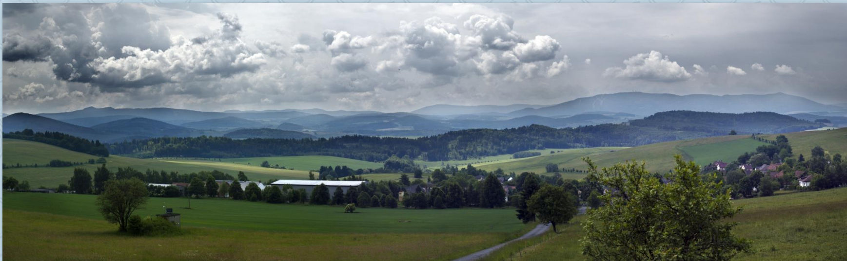
Výhled z rozhledny nad Novou Vsí

Vrcholek nad Novou Vsí je součástí hřebene, který odděluje od sebe povodí Berounky, jejíž vody se skrze Vltavu a Labe vlévají do Baltického moře a povodí Regenu, který se vlévá do Dunaje a ten pak do Černého moře. Místní obyvatelé (alespoň předpokládám, že to byli oni) zde vybudovali velice pěkné místo k posezení i s vysvětlujícími mapkami. A zcela nově zde vyrostla i malá dřevěná rozhledna, což je skvělé, protože výhled na Šumavu je odtud nádherný. Je vidět, že i málo postačí k tomu, aby naše cesty byly, díky takovému místům, mnohem příjemnější a pestřejší.